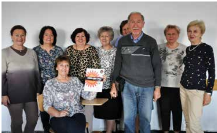
Learning English is my hobby