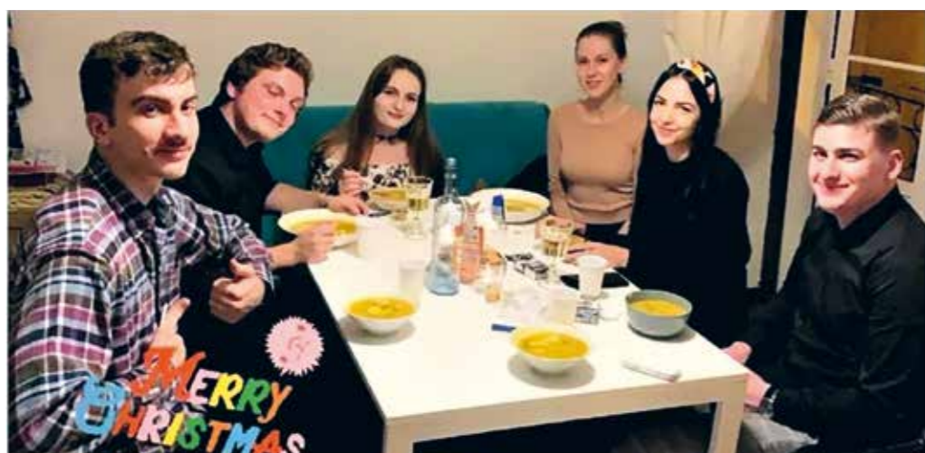
AN UNFORGETTABLE EXPERIENCE! ERASMUS IN PORTUGAL WINTER SEASON A.Y. 2019/2020

Podsumowując, polecam wszystkim taki wyjazd. Zdobywajcie doświadczenia i spełniajcie marzenia :) ■