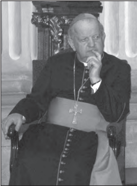
Wielki Kanclerz Uniwersytetu JE ks. kard. dr Stanisław Dziwisz