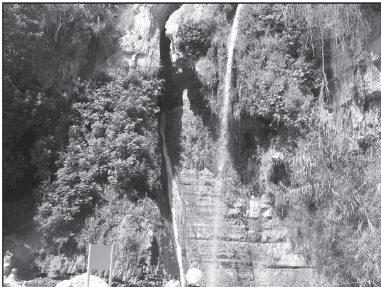
Wodospad Dawida w En-Gedi