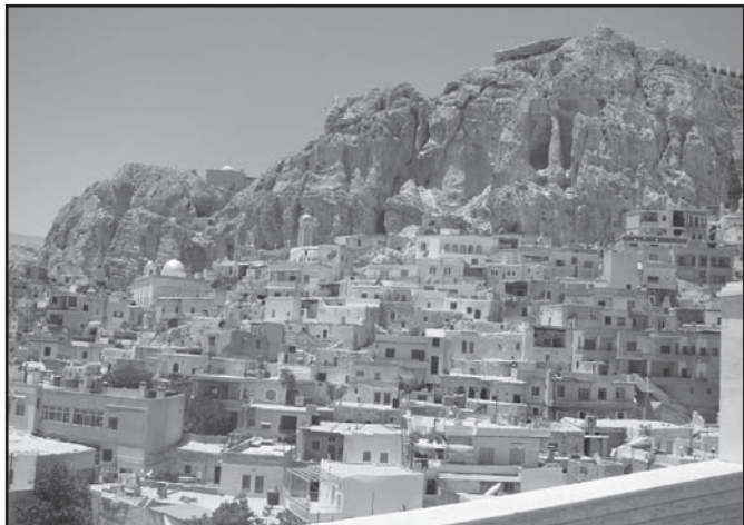
Maalula – jeden z większych ośrodków chrześcijaństwa w Syrii.