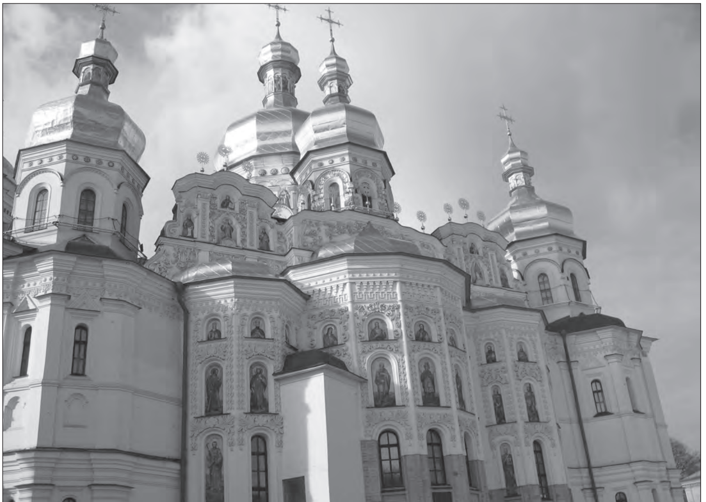
Na terenie kompleksu cerkiewnego Ławry Pieczersko-Kijowskiej

Wjazd na Ukrainę wiąże się ze zmianą strefy czasowej i koniecznością przesunięcia wskazówek zegarków o godzinę do przodu. Tę symboliczną „utrąę” godziny zrekompensowało nam sprawne i szybkie przekroczenie granicy na przejściu Korczowa-Krakowiec.