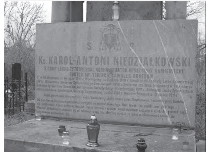
Cmentarz w Żytomierzu